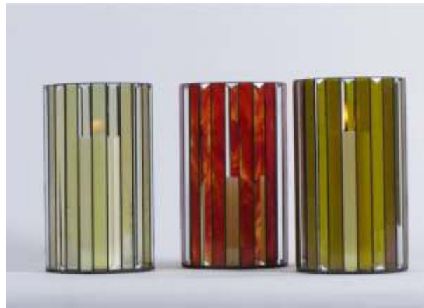
Kerzenleuchter Nr. 1